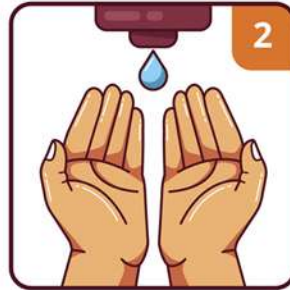
APPLY THE SOAP