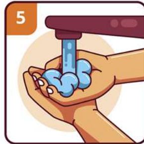
RINSE YOUR HANDS