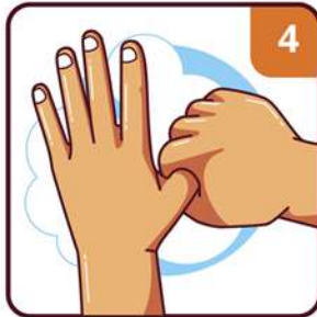
CLEAN YOUR THUMBS