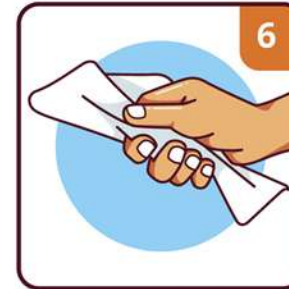
DRY WITH SINGLE USE TOWEL