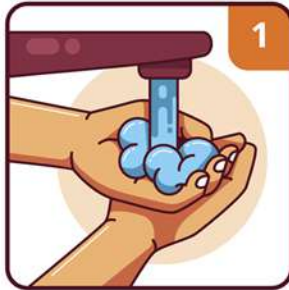
WET YOUR HANDS