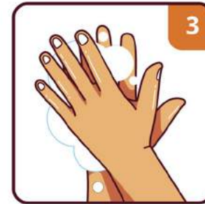
SCRUB YOUR HANDS