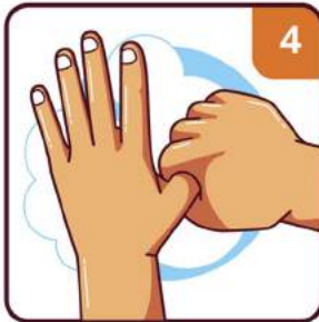
CLEAN YOUR THUMBS