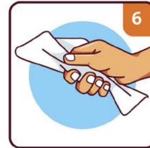
DRY WITH SINGLE USE TOWEL