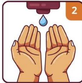
APPLY THE SOAP