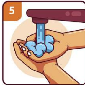
RINSE YOUR HANDS